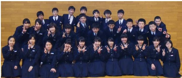
中学部生徒委員会委員

なりましたが我々を指導していただいた先生方、若竹の原稿依頼など協力してくれた同級生や下級生のみなさん本当にありがとうございました。